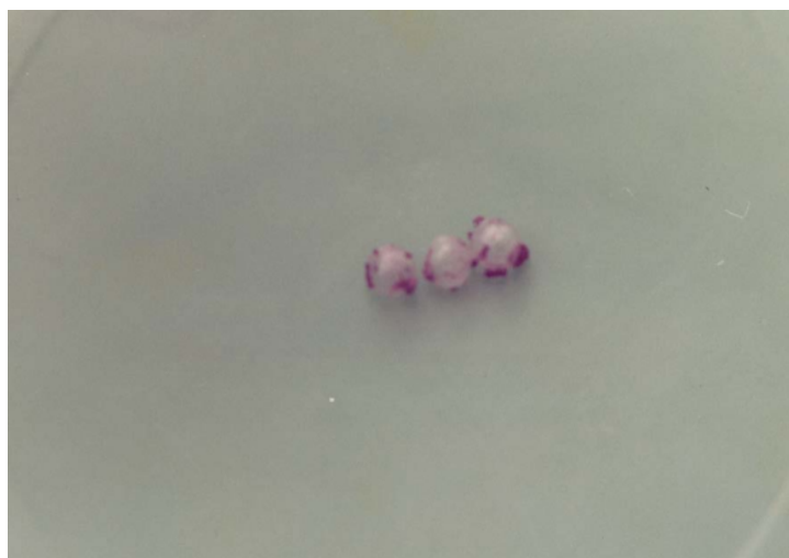
شکل ۴ - تخم حلزون H. candeharica