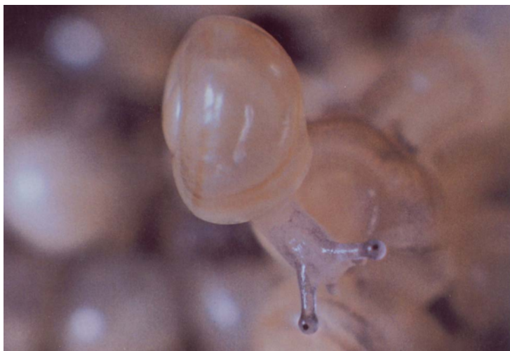
شکل ۳ - لارو حلزون H. candeharica