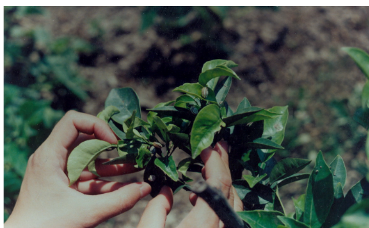
شکل ۲ - حلزون بالغ H. candeharica